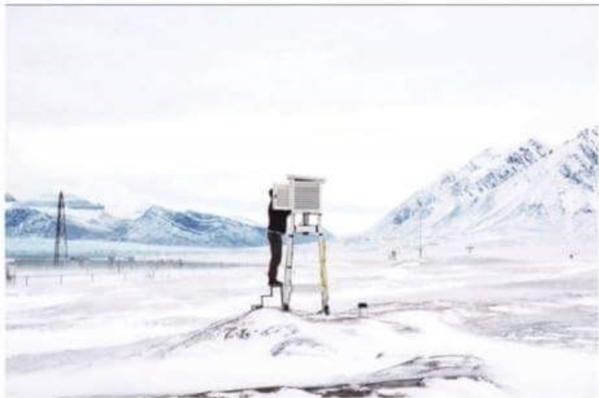
Research at the End of the World, Anna Filipova, 2016.

Op de Noorderlicht Internationale Fotomanifestatie is werk van 74 fotografen uit 26 landen te zien, samen meer dan 700 beelden. Naast 7 locaties in de Groningse binnenstad werkt het festival voor het eerst samen met kunstcentrum Kink in Assen en Museum De Buitenplaats in Eelde. Een passepartout, inclusief catalogus, kost 30 euro.